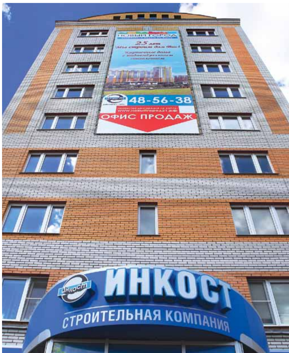
Продолжение, начало на стр. 1

по голое поле, куда надо было провести как минимум электричество. На сегодняшний день мы сдали четыре дома, завершаем строительство еще двух и работаем над новыми позициями.