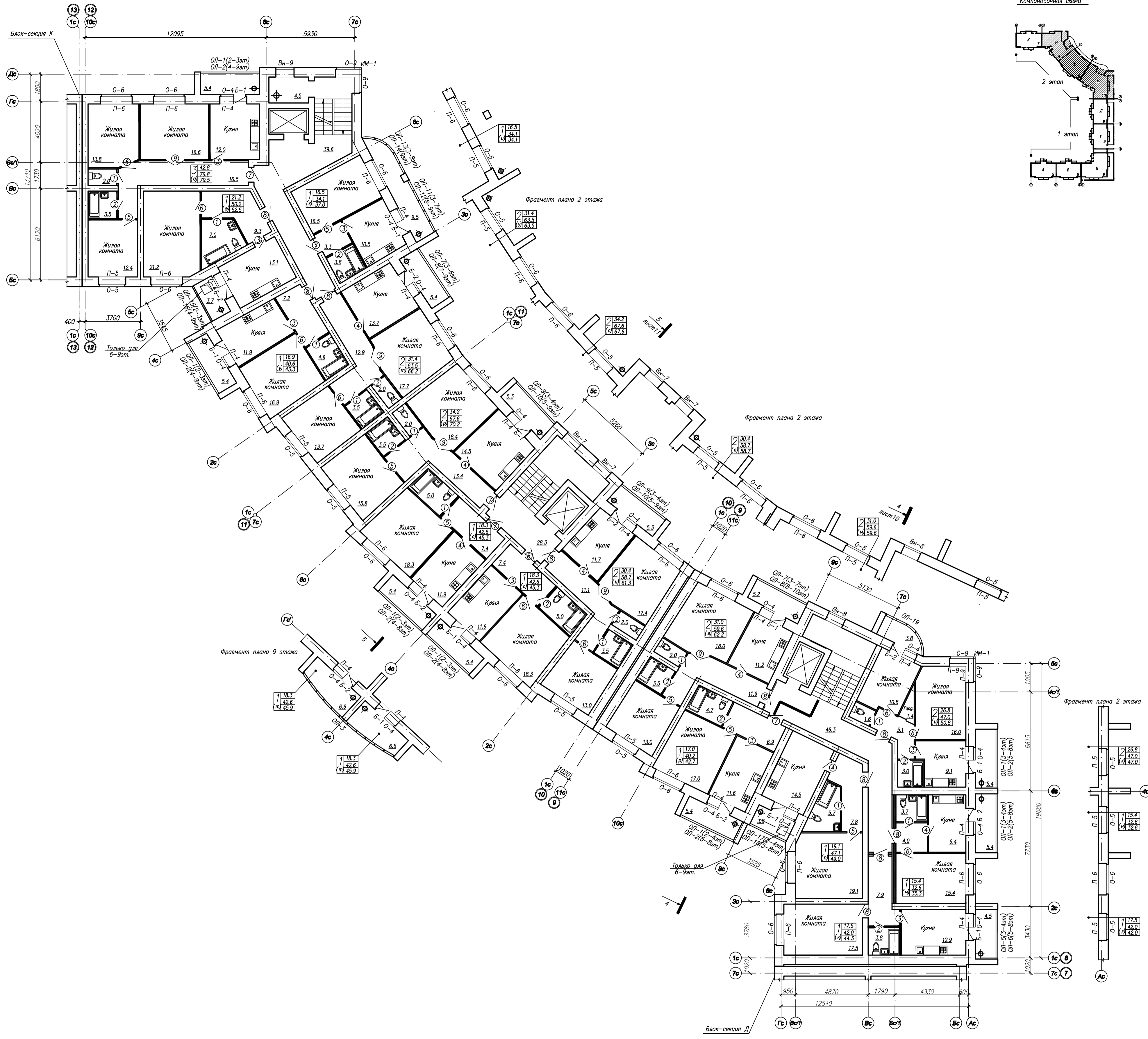
ПЛАН 10 ЭТАЖА б/с Е(2 уровень)